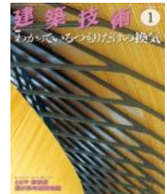
建築技術2019年1月号 特集「わかってるつもりだけの換気」 監修：南雄三、田島昌樹