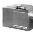
新型送風機 SPVDC400 ・シンプル構造で高静圧・大風量 ・ロコファンレスモーター採用、換気量コントロール可能