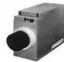
高性能空気清浄機 ACS-300 ・電気消費電力で2.5畳以下のPM2.5を95%以上除去(送風機長2000時間) ・フィルターや活性炭層ユニットは簡単に水洗い可能 ・軽電圧コンソリドで消費電力4Wと経済的