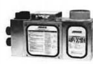
第3種換気用空気清浄機中間換気システム AMPVDC150/6 ・ダクト6箇所に通風可能 ・リタクトを併用して送風11畳分 AMPVDC2000Rもございます