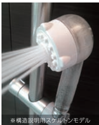
※構造説明用スケルトンモデル

バブルストレート（ストレート水流）では、ファインバブルの洗浄力・浸透・温まりといった特性をダイレクトに感じられます。勢いのある水流の中に多くの気泡を閉じ込めました。