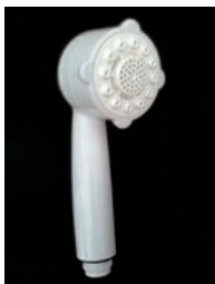
※画像は発売前のものです。