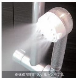
※構造説明用スケルトンモデル